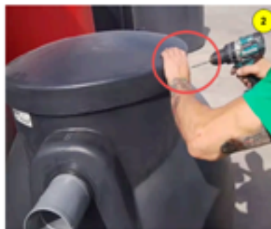
Aflojar el tornillo de fijación derecho