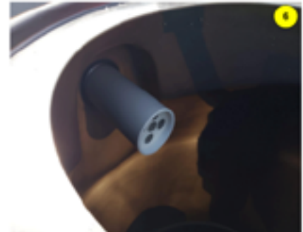
Verificar la correcta posición del tapón Klapsto perforado en la salida.