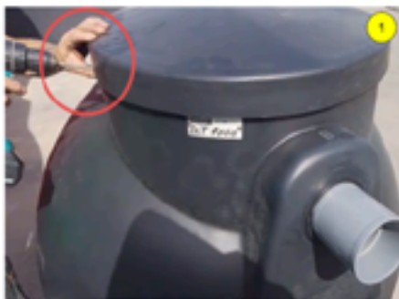
Aflojar el tornillo de fijación izquierdo

Para las operaciones de limpieza y revisión del prefiltro, desmontar la cesta filtrante siguiendo el procedimiento indicado y las figuras 1 a 6: