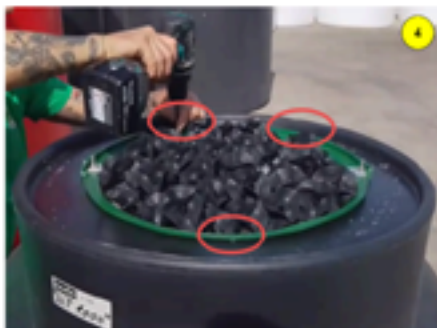
Aflojar los 3 tornillos de fijación de la cesta