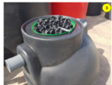
Retirar la tapa